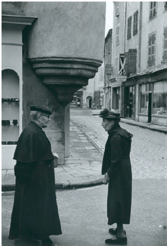
HENRI CARTIER-BRESSON Provincial Characters France 1971

Mit der ersten Fotografieauktion im Wiener Westlicht ist ein neuer Fotografieauktionsplatz hinzugekommen. Bei der ersten Auktion am 5. Dezember 2009 wurden die meisten Fotografien über dem Schätzpreis verkauft. ( www.westlicht-auction.com ) Das Angebot war von der Qualität durchaus hochwertig und international vergleichbar.