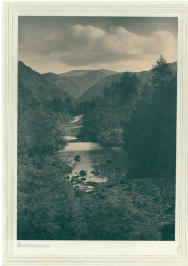
FREDERICK H. EVANS, Borrowdale 1885