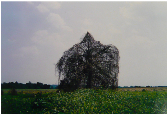
WILLIAM EGGLESTON, Tree covered with Kudzu Vine, 1972

Wir sind weiterhin auf der Suche nach einem Ort um die Werke des Fonds auch dauerhaft der Öffentlichkeit zugänglich machen zu können.