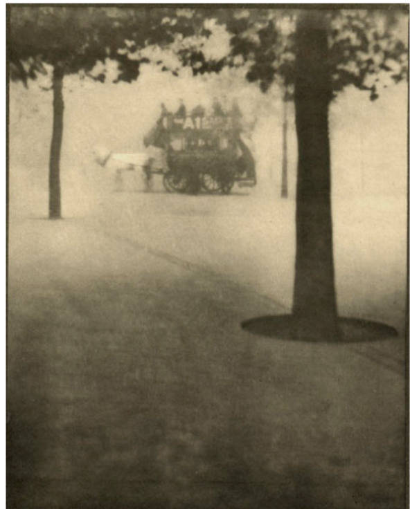
ALVIN LANGDON COBURN London Portfolio 1909

With the first photography auction taking place at the Wiener Westlicht ( www.westlicht-auction.com ), a new stage for art photography auctioning has been created. At their first auction on the 5 th of December 2009, the majority of works were sold above their pre-auction estimated price ranges. Works on offer represented high quality equal to international standards.